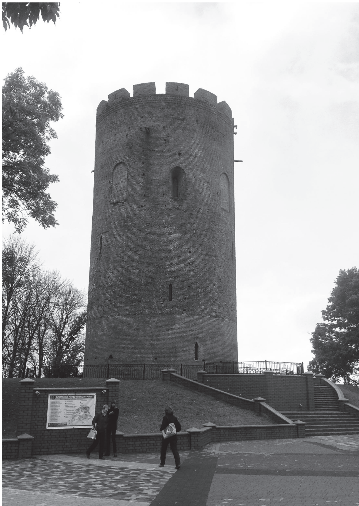
Каменецкая башня, как и другие белорусские замки, посещается в основном организованными группами туристов