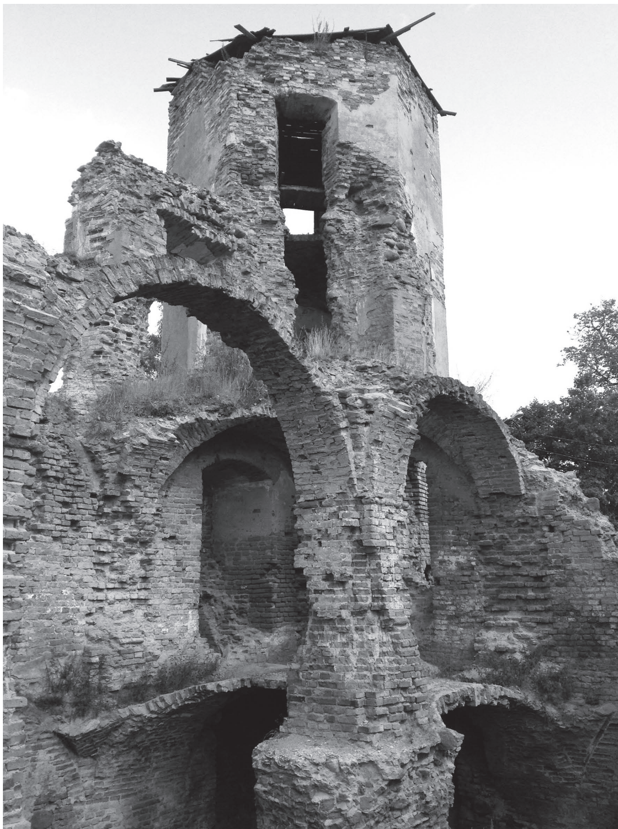
Руины Гольшанского замка в ожидании консервации и экспозиции