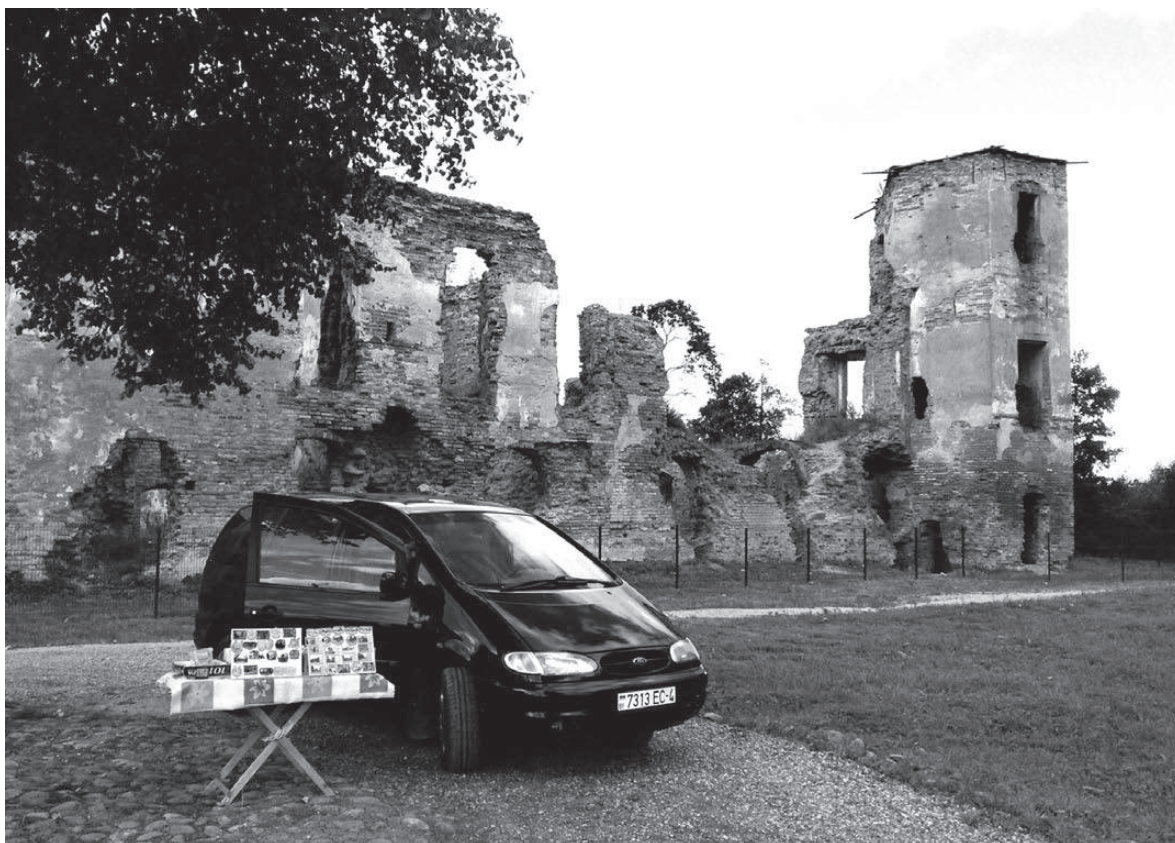
Местный бизнес — продажа сувениров около Гольшанского замка