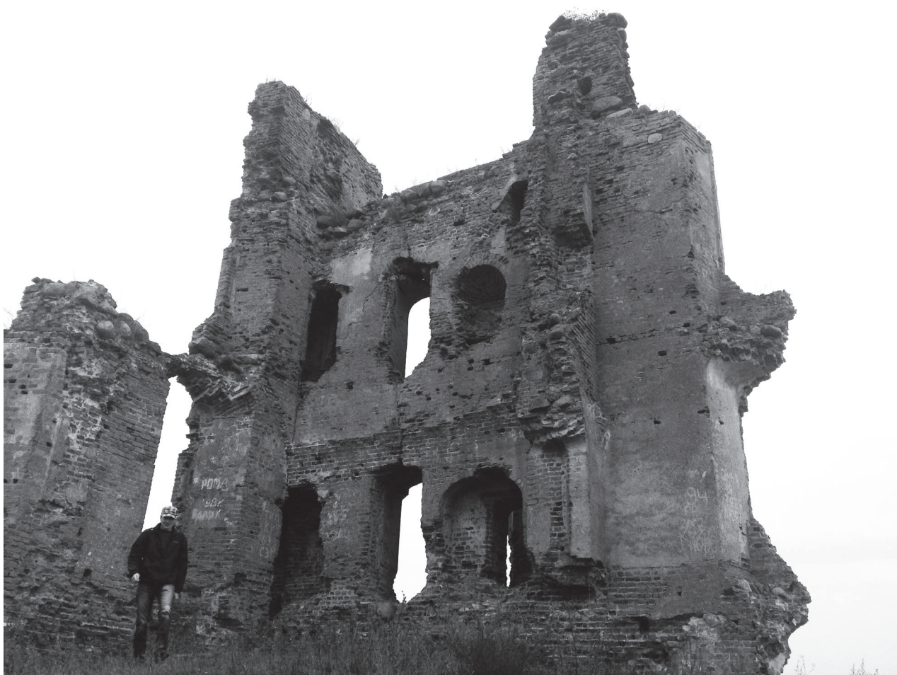
Руина замка в Смоленых грозит обвалиться

Таким образом, после проведения серии экспедиций и консультаций с реставраторами, местными активистами, чиновниками и экстерриториальными экспертами, можно выделить следующие основные проблемные аспекты обеспечения социальной части реставрационных проектов.