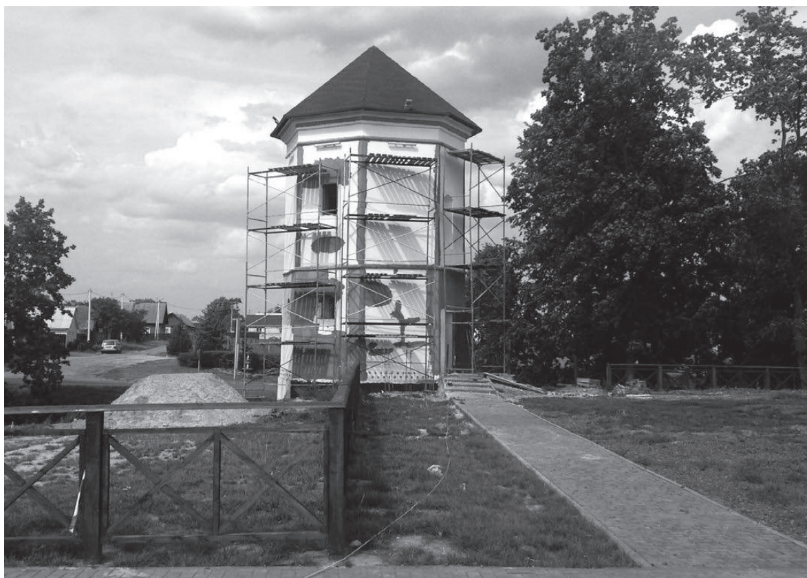
Одна из башен Быховского замка в процессе ремонта