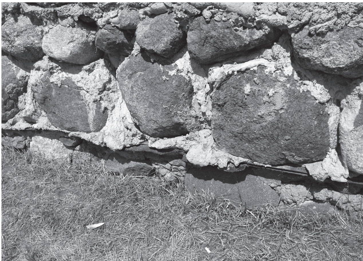
Рубероид в средневековом Лидском замке

При этом следует иметь в виду, что роль замка в большом и маленьком городах разительно отличается. С одной стороны, в большом городе людей, восприимчивых к таким поводам и принимающих участие в самой коммуникации больше в абсолютных числах, с другой же в пропорции к общему числу жителей их меньше. В больших городах замок как бы растворяется в большом количестве других знаковых городских объектов и символов.