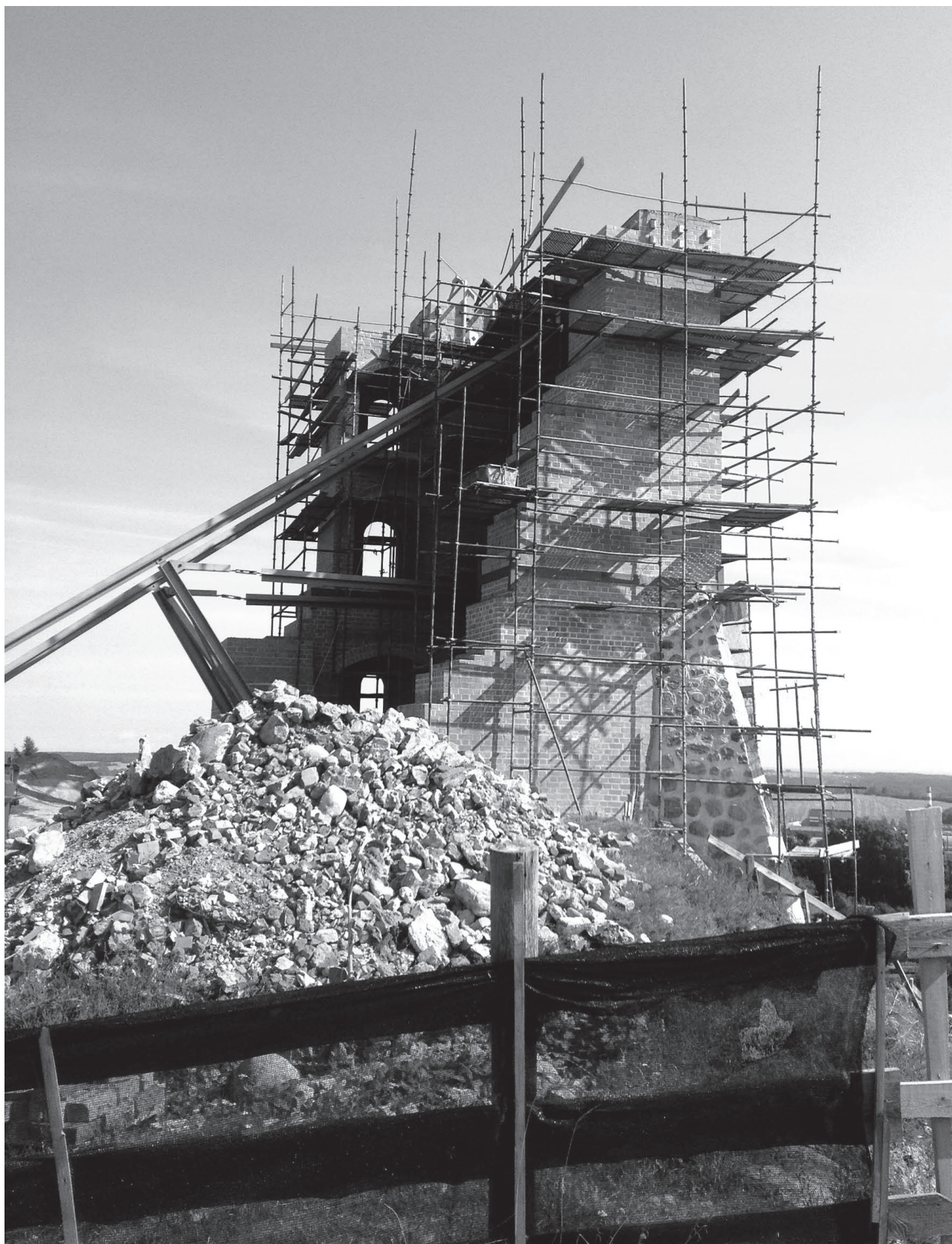
Башня Щитовка в процессе консервации и укрепления