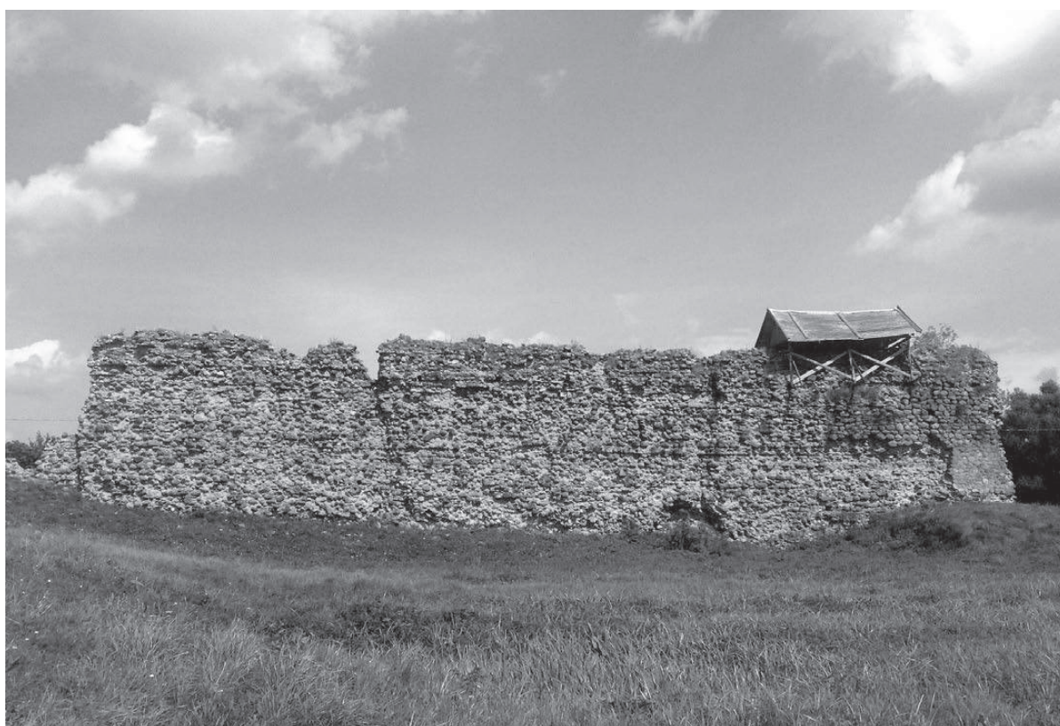
Кревский замок с неоконченной консервацией