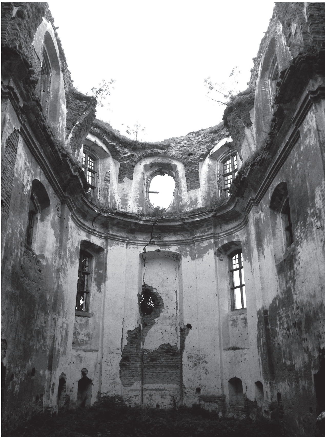
До сих пор некоторые руины в Смоленских используются как источник стройматериалов