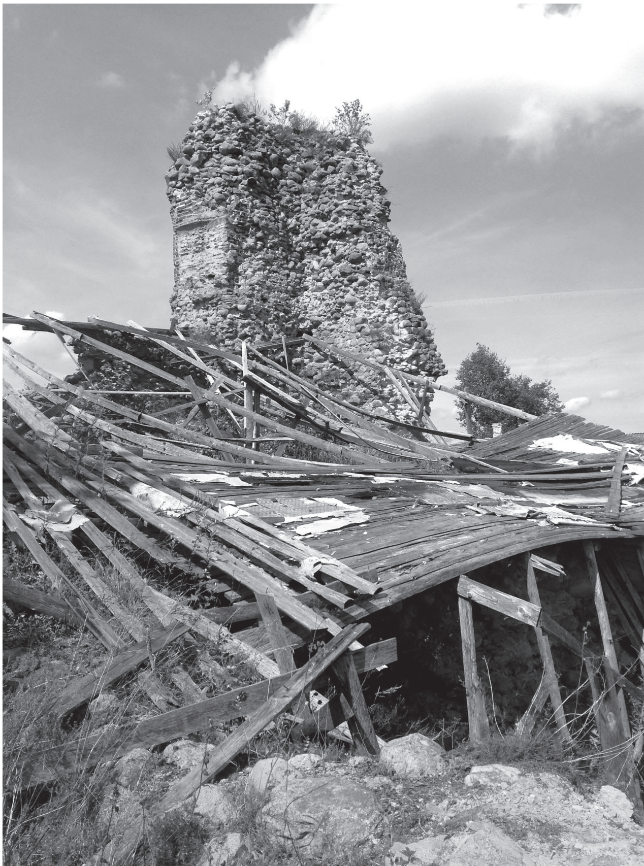
Законсервированный археологический раскоп в Крево больше напоминает разруху военного времени