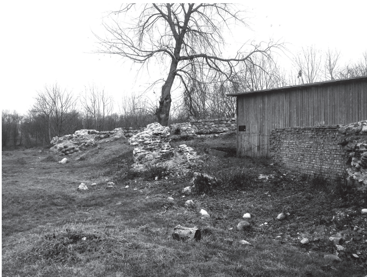
Руины Гродненского замка, почти невидимые для туристов

Актуализация и восстановление замков в свою очередь влечет за собой связанные явления, такие как осознание/переосознание городской истории, перезапись локальной идентичности, появление связанных общественных инициатив — местные краеведы и рыцарские клубы, туристическое движение, приезды журналистов и киношников, повышающие престижность объекта. Все это способствует изменению образа населенного пункта в целом и, следовательно, должно учитываться при определении целей реставрационных проектов.