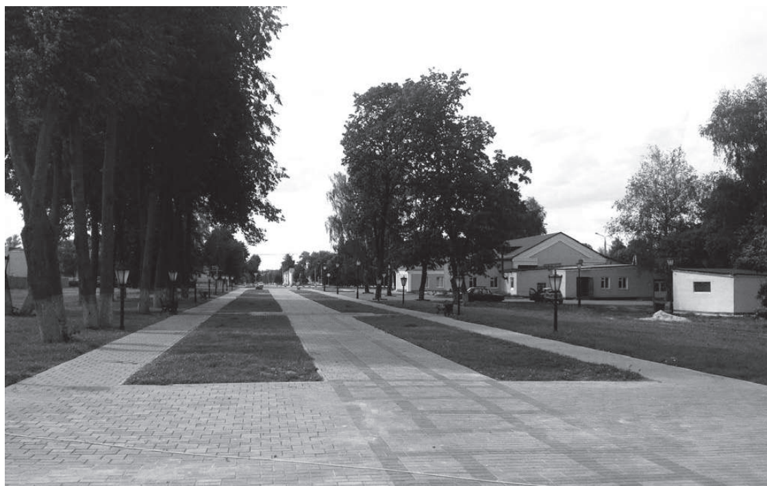
Территория вокруг Быховского замка пустынна