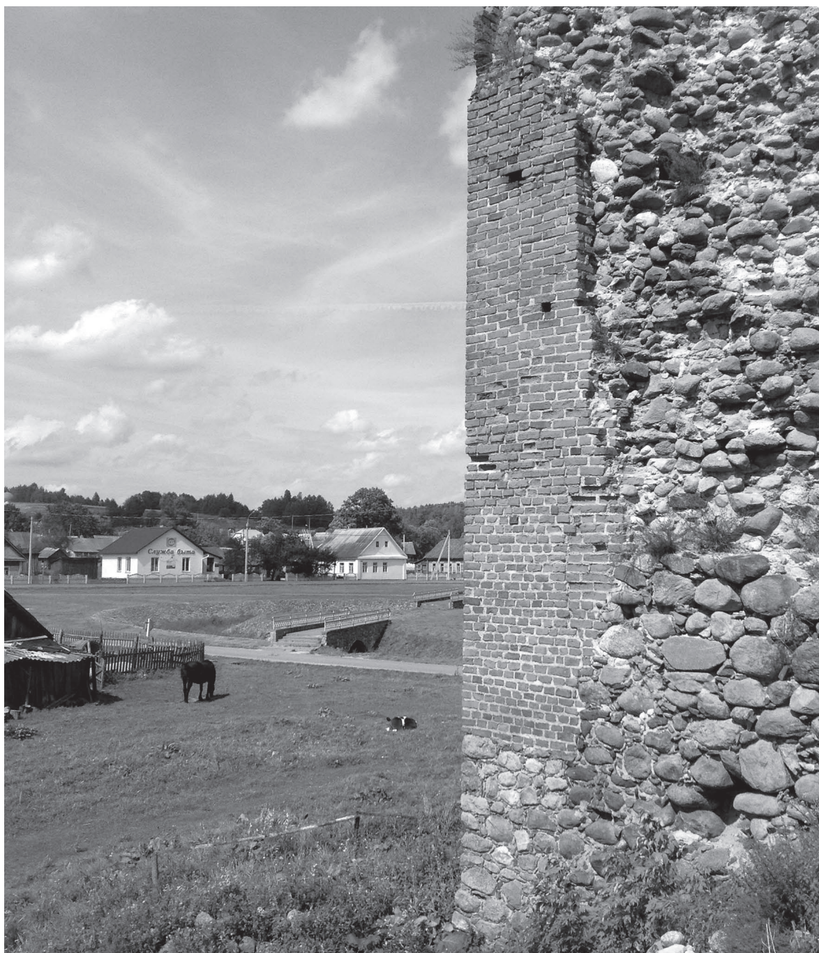
Лошади рядом с Кревским замком

Зафиксированные в экспедициях сценарии использования замков весьма разнообразны. От замка к замку степень его включенности в повседневные практики горожан/сельчан варьируется. Реставрационные проекты должны не сводить данные сценарии к минимуму, а скорее расширять возможности для местных жителей.