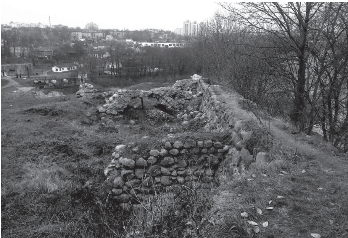
В данной части Гродненского Старого замка запланировано целостное восстановление объекта

Подобного уровня проектирование сможет обеспечить устойчивость культурных объектов и целых ландшафтов в средне- и долгосрочной перспективе.