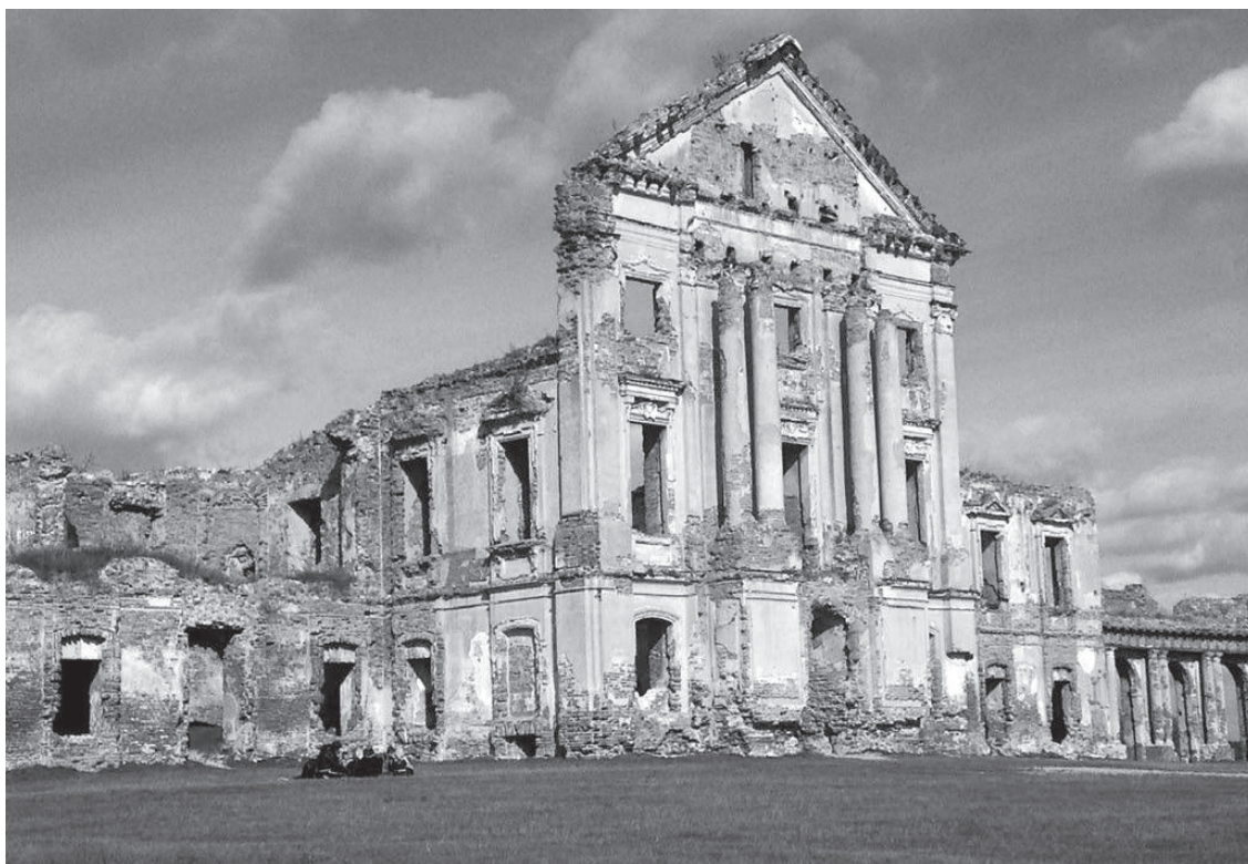
Центральный фасад Ружанского дворца сильно контрастирует с восстановленной въездной группой