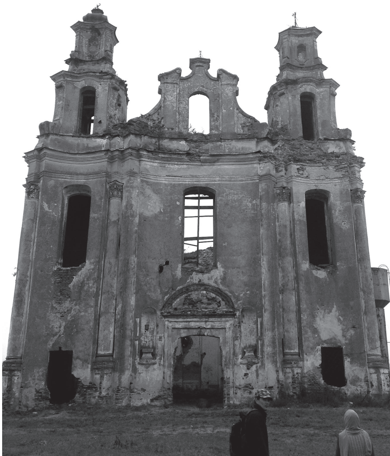
Смоляны богаты на живописные руины