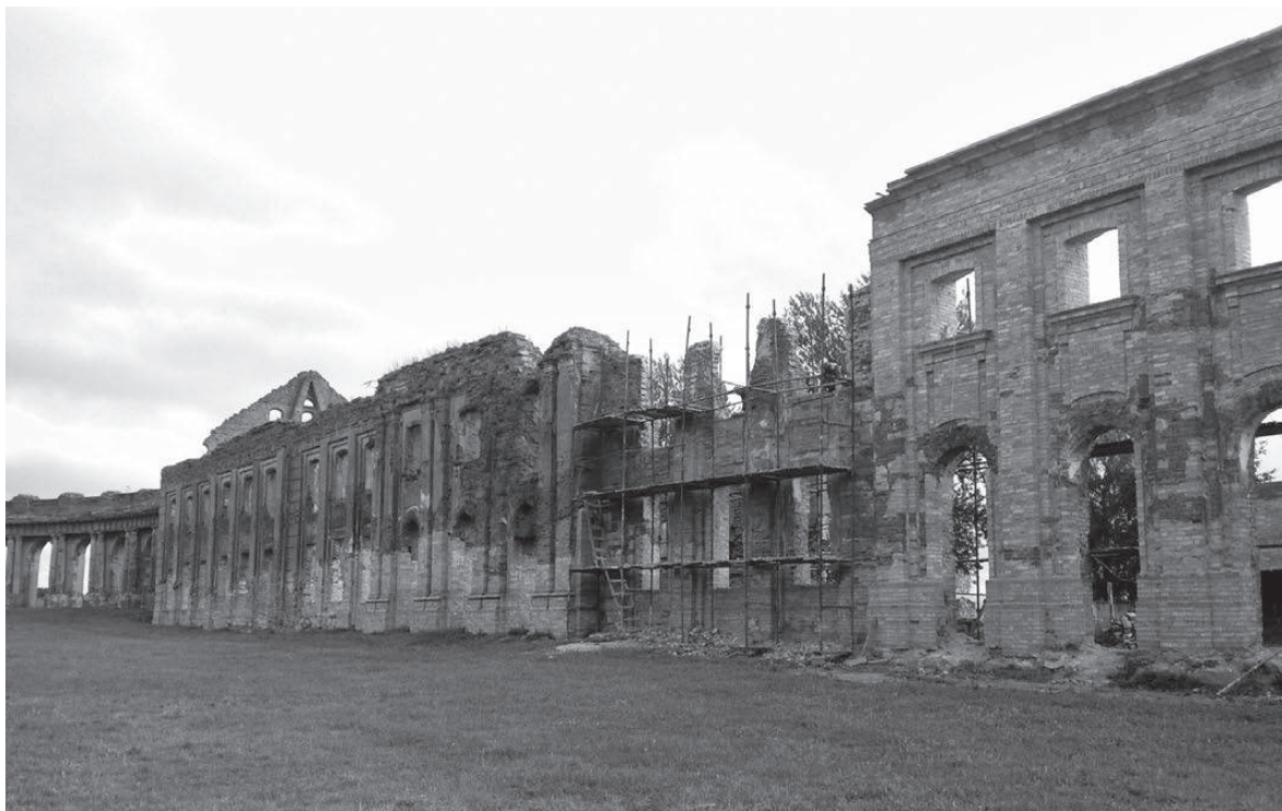
Процесс реставрации восточного корпуса Ружанского дворца