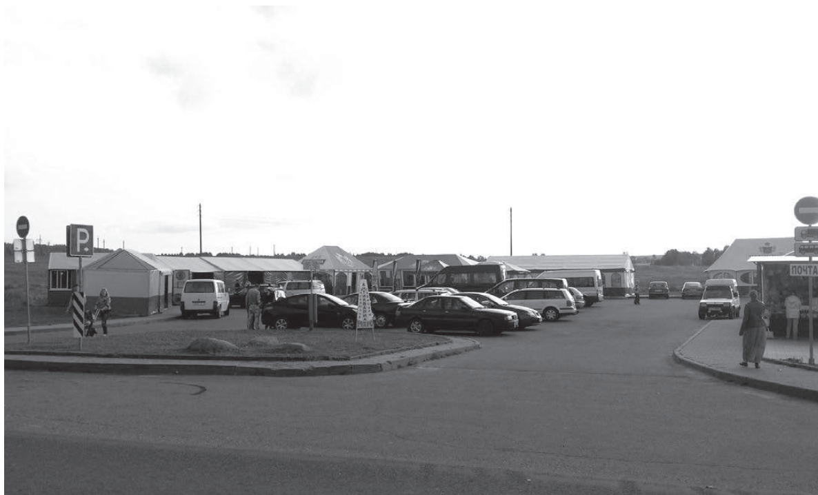
Забитая парковка и сувенирные лавки возле Мирского замка