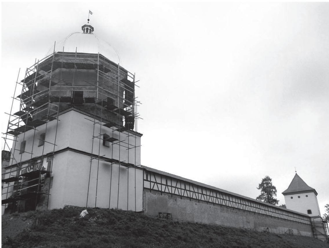
Усилия реставраторов в Любче видны невооруженным глазом. Все работы сделаны силами волонтеров