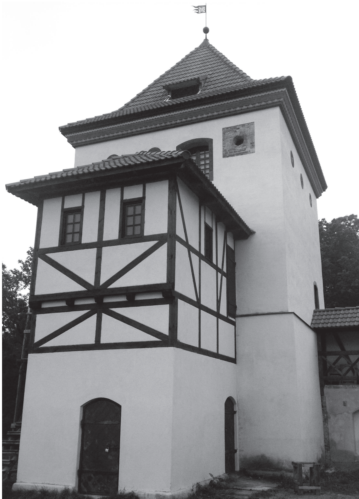
Фахверк в Любче