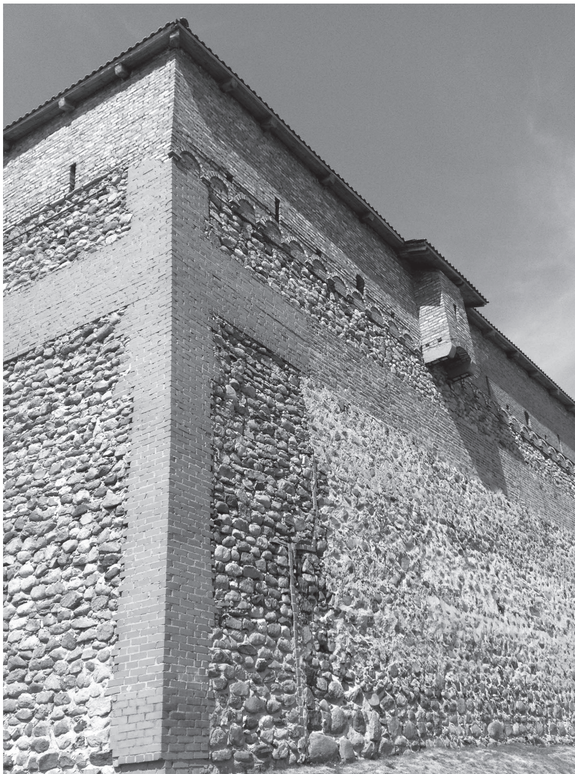
Реставрационные наслоения в Лидском замке