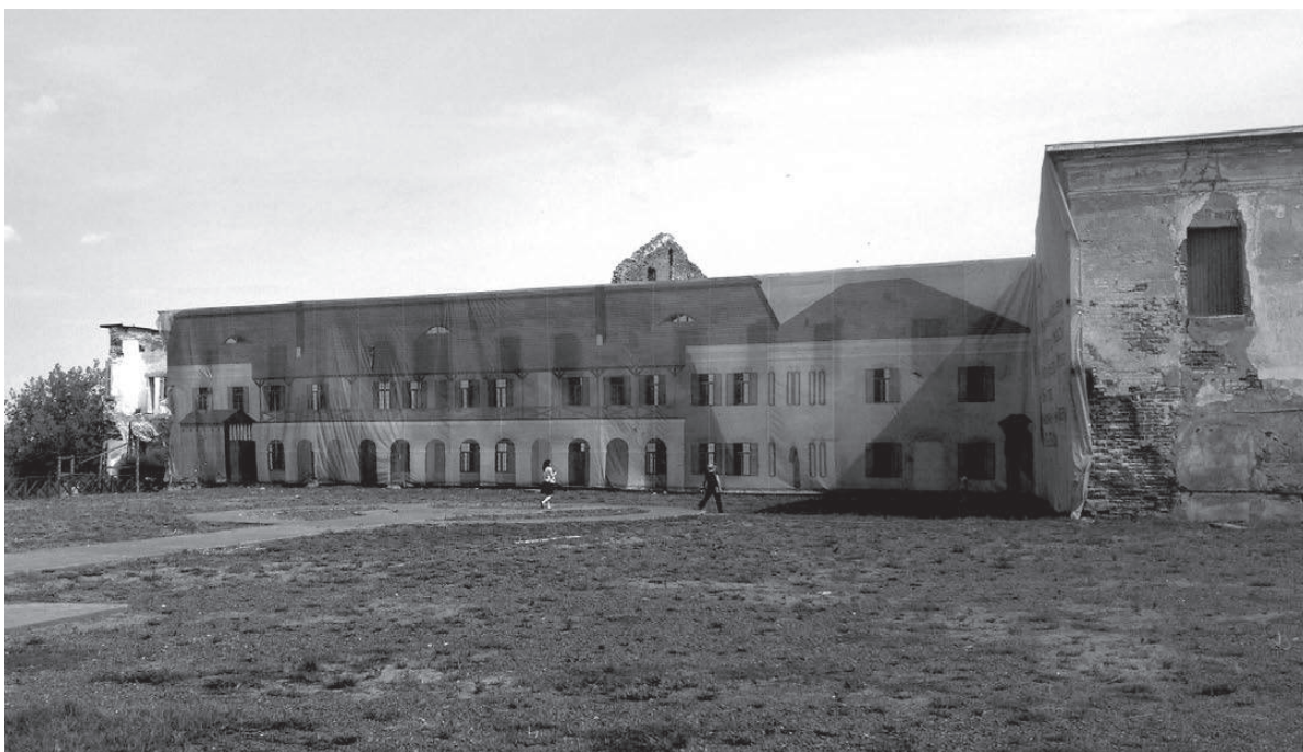
Быховский замок, закрытый строительной сеткой с распечатанным фасадом