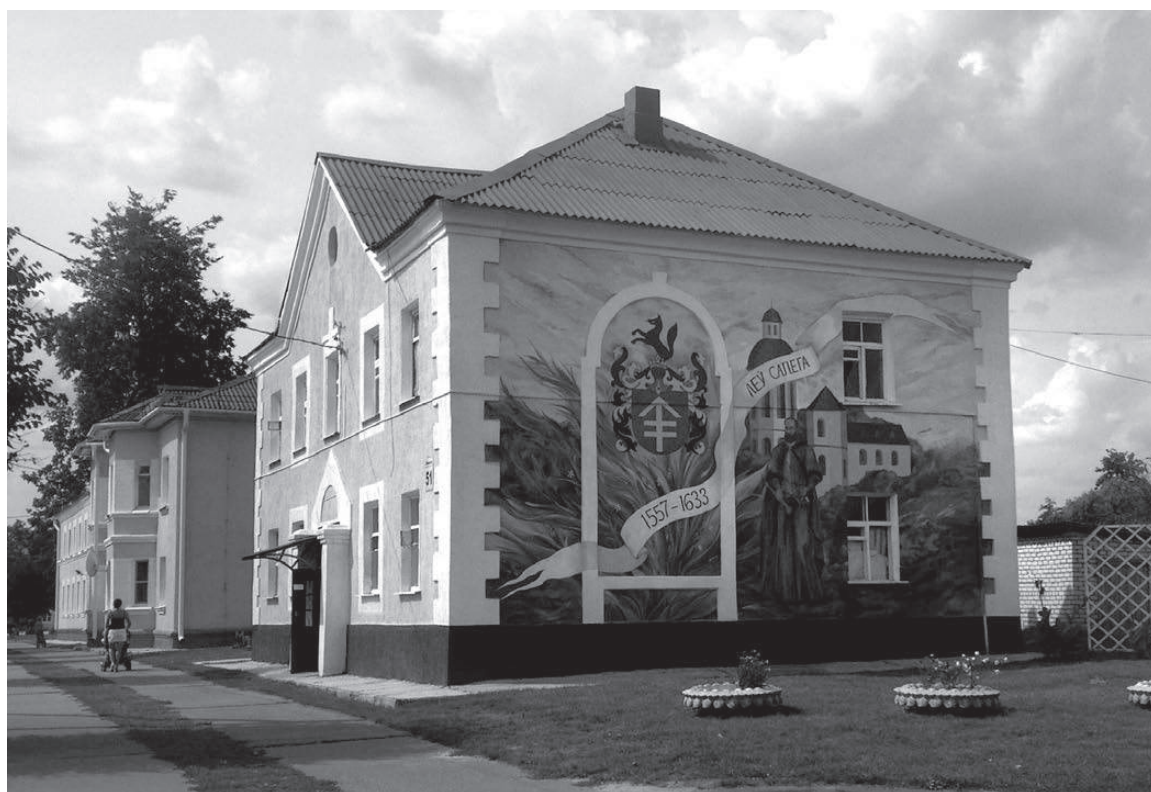
Фрески на стенах домов в Быхове — популярный прием эстетизации городского пространства в Беларуси